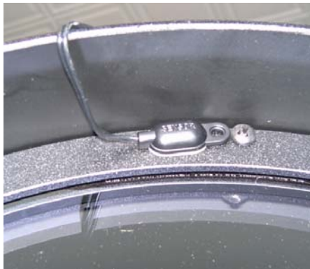
Sensor attached to the corrector