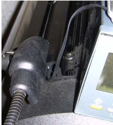
Cable going into the hollow top rail