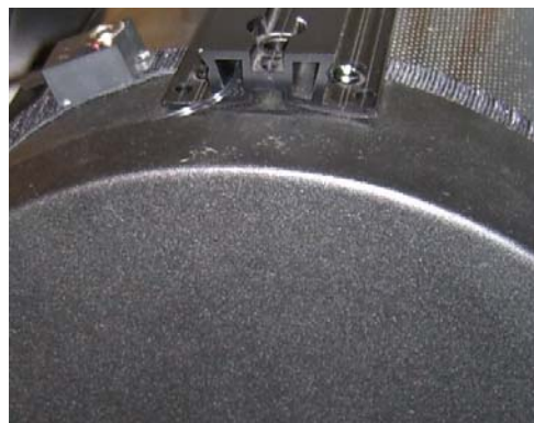
Front cover of OTA can still be attached while sensor mounted

The device featured a green backlight display. I changed the green backlight by removing the green rubber cover from the internal light bulb and painting the bulb using red fingernail polish from my wife. Now the backlight is red which helps preserve the dark adaptation of my eyes.