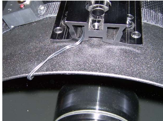
Front of the OTA with the cable coming out of the rail system